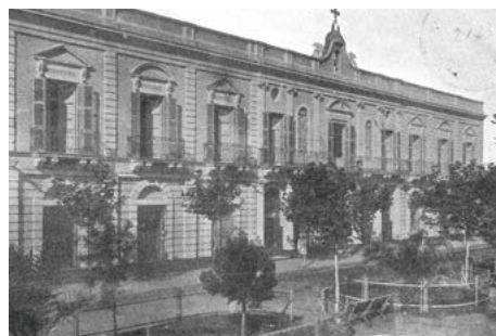
Antiguo Hospital San Felipe

dientes donde se alojaban quienes padecían enfermedades contagiosas. Se completaba el edificio con salas donde se brindaban diferentes servicios, con un importante apoyo de la señora Justina Acevedo de Botet.